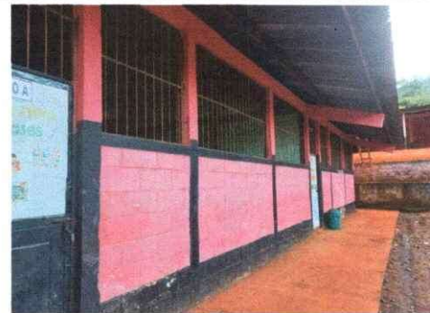
Foto 6: Se observa en la imagen pintura actual de las paredes de la escuela

Observación: Si es necesario se pueden agregar hojas adicionales y actualizar el número de hojas.