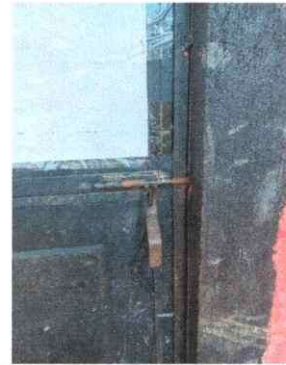
Foto 4: Se observa una de las puertas sin chapa, necesita mantenimiento y chapa